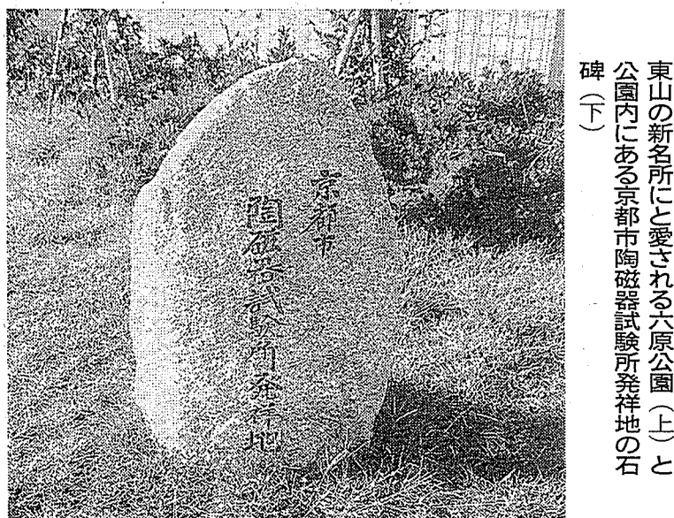
東山の新たな所にと愛される六原公園(上)と公園内にある京都市陶磁器試験所発祥地の石碑(下)