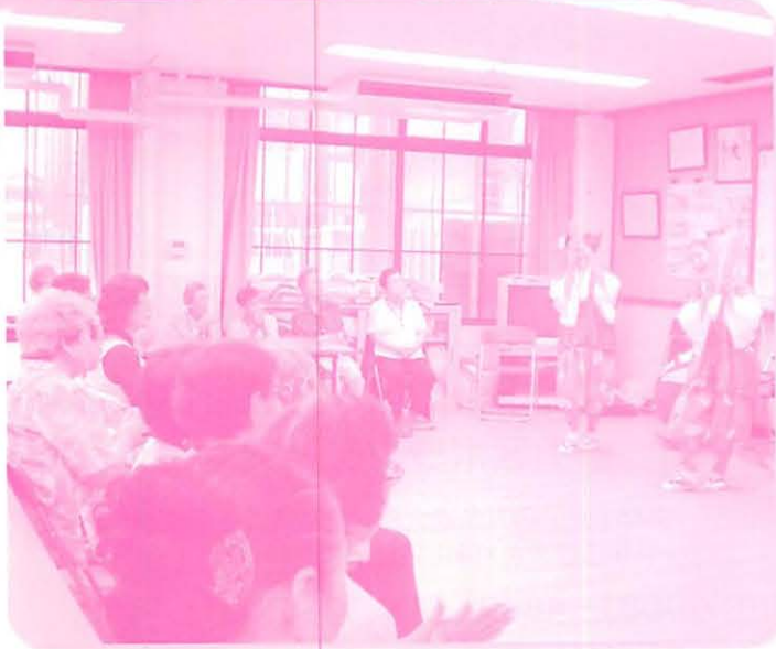
すこやか学級事業の様子